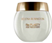
RAFFERMISSANTE Re-Plasty Age Recovery, Helena Rubinstein.

● Le principe : rétablir l'harmonie des proportions avec des injections d'acide hyaluronique. « Selon les cas, on peut redonner une douce convexité au front pour le féminiser, adoucir et affiner un nez en gommant sa bosse, supprimer le sillon entre la lèvre et le menton qui se creuse avec le temps, augmenter la projection centrale du menton... », énumère le Dr Olivier Claude. Ces corrections suffisent à redessiner et féminiser l'ovale sans l'alourdir.