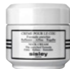
COMPLÈTE Crème pour le Cou, Sisley.