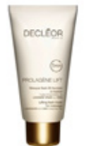
DYNAMISANT Masque Prolagène Lift, Decléor.

• Un cou empâté... Il n'en faut pas moins pour alourdir un visage et aggraver les signes du vieillissement. • La parade : la cryolipolyse, une technique qui a largement fait ses preuves pour réduire les bourrelets localisés par le froid. « Le nouvel applicateur CoolMini (Zeltiq) permet