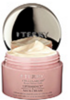
REMODELANTE Liftessence Neck Cream, by Terry.